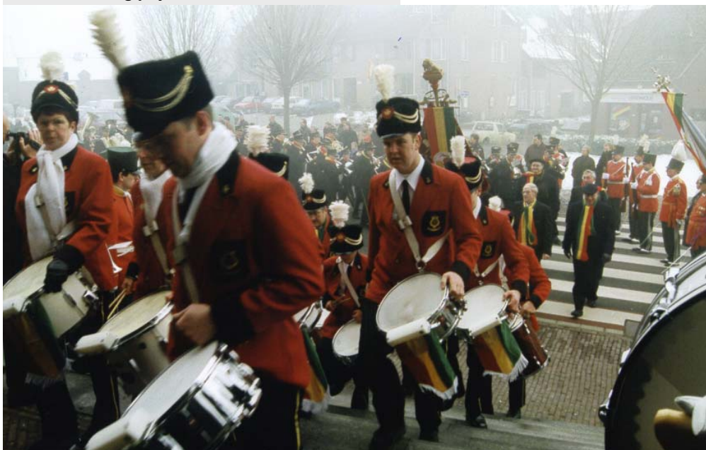
De drumband en het korps begeleiden prins Mark III naar de kerk.