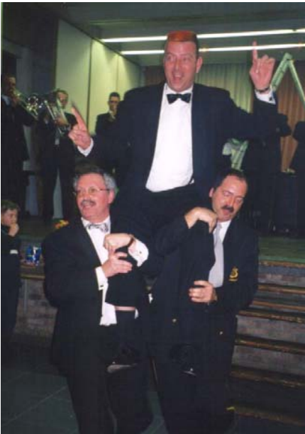
Geert op de schouders Hij heeft het verdiend.