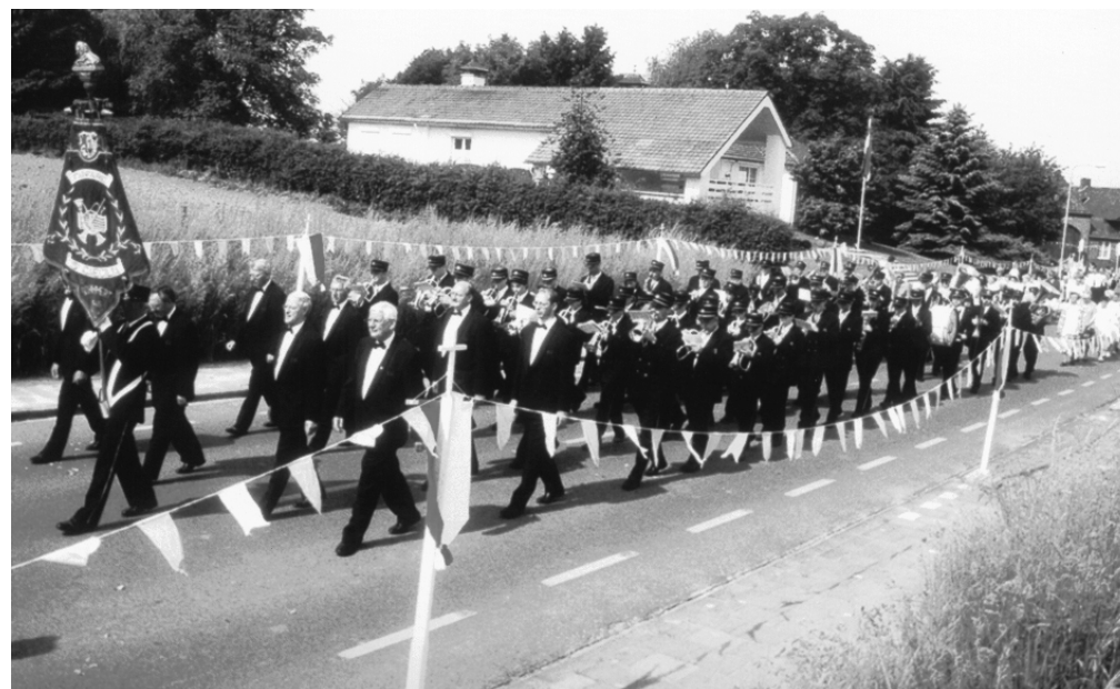
De fanfare tijdens de laatste bronkprocessie