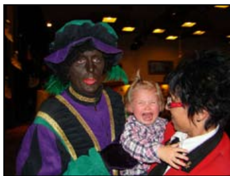
Juul is onder de indruk van zwarte Piet