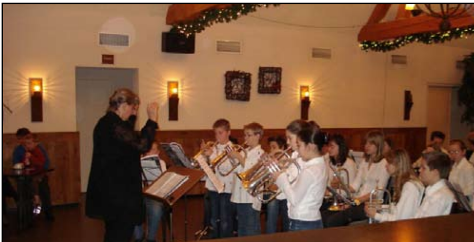
Opperste concentratie tijdens het "Eerste-noten concert"