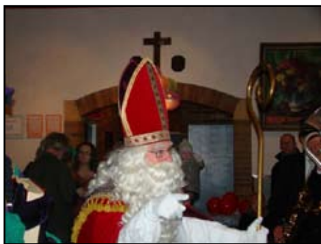
Sint op zoek naar zijn troon

Om 14.45 uur vertrok de Fanfare onder een grijs wolkendek maar nog wel zonder vlokken vanuit het gemeenschapshuis richting 't Weverke. Eenmaal aangekomen bij 't café begon de sneeuw reeds uit de lucht te dwarrelen. In overleg met de organisatie werd dan ook maar snel besloten de route iets in te korten. En dat was maar goed ook, want het begon dan ook steeds lelijker te doen!