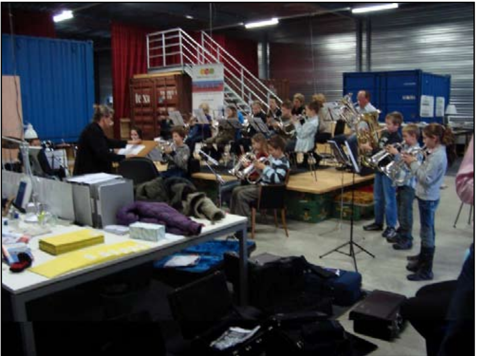
Els aan het werk tijdens een repetitie van de jeugdfanfare bij New Energy Systems