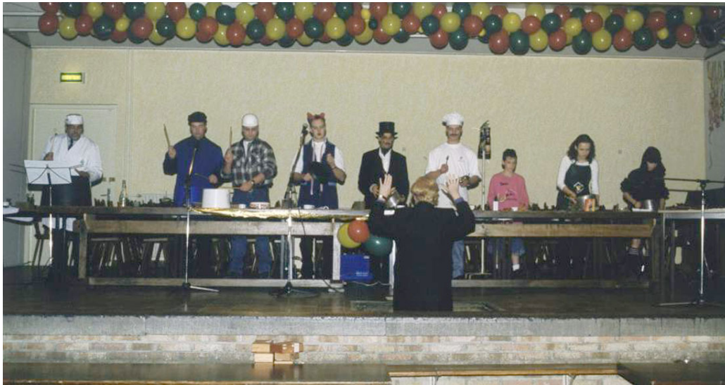
Tijdens het Caeciliafeest bracht de drumband op bijzondere wijze een prachtige act met alle mogelijke keukenattributen, welke niet alleen erg ludiek was maar ook muzikaal verrassend goed.

Ook zullen wij concerten meer onder de aandacht brengen in de media om de publieke belangstelling waar mogelijk te vergroten.