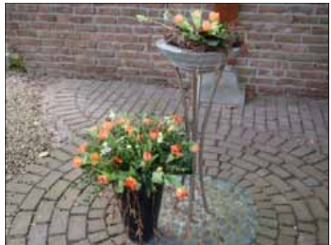
Bloemstuk gemaakt door Jose Steijns