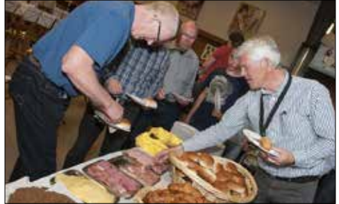
Foto's ontbijt sessie i.v.m. voorbereiding voor het WMC, na een lange tocht te voet naar Meerssen