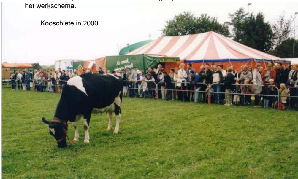
Kooschiete in 2000

Het was er gezellig druk en van alles voldoende voor jong en oud. Het weer was ideaal en we hopen dat we deze tocht nog vaak mogen meemaken.