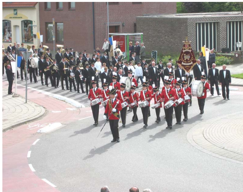
De fanfare in de processie op Kermiszondag