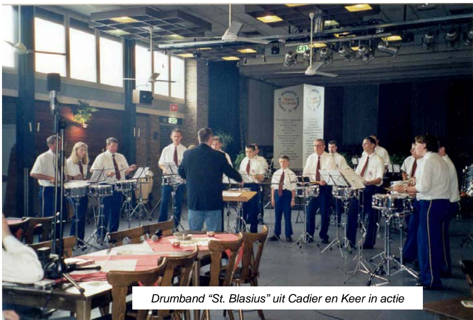
Drumband "St. Blasius" uit Cadier en Keer in actie

Kortom, een zeer geslaagde en gezellige muziekmiddag waarbij de twee optredende verenigingen hun kunnen na het concours in september j.l. weer eens konden tonen en ten gehore konden brengen.