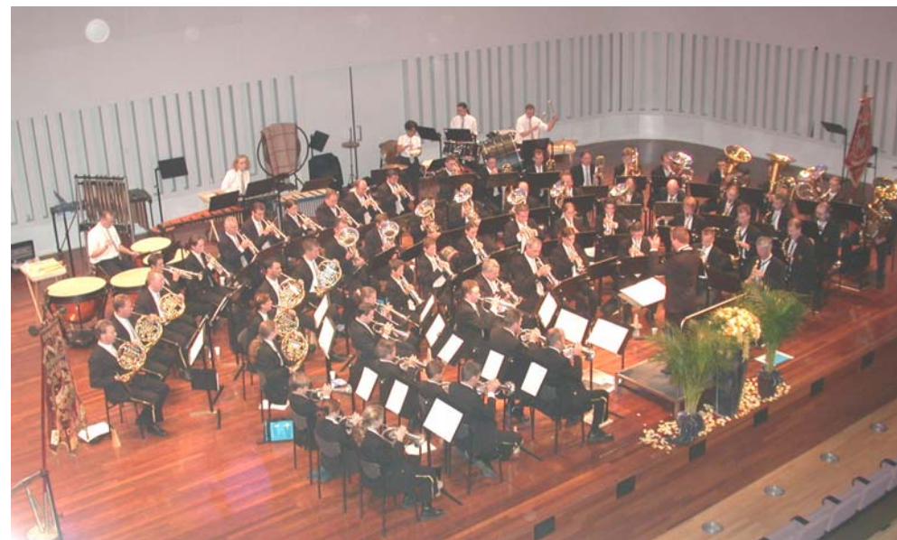
Onze Fanfare tijdens het Concert in deschouwburg te Tilburg op 6 oktober