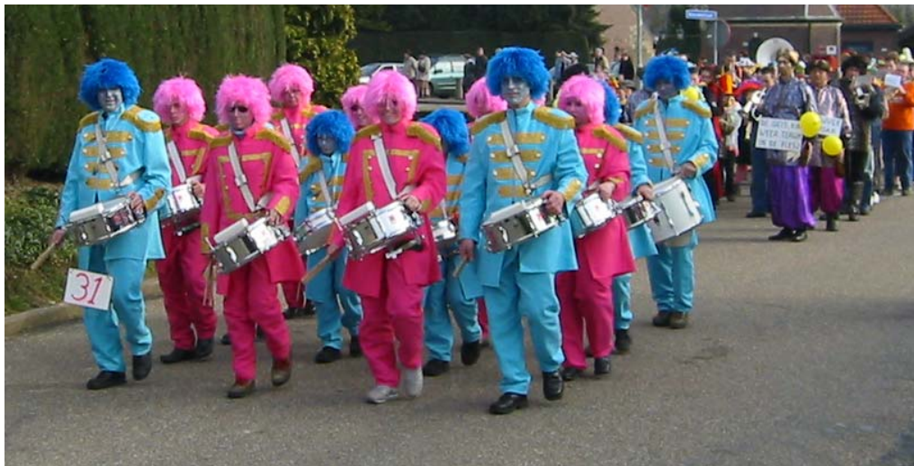
De drumband in de nieuwe kostuums