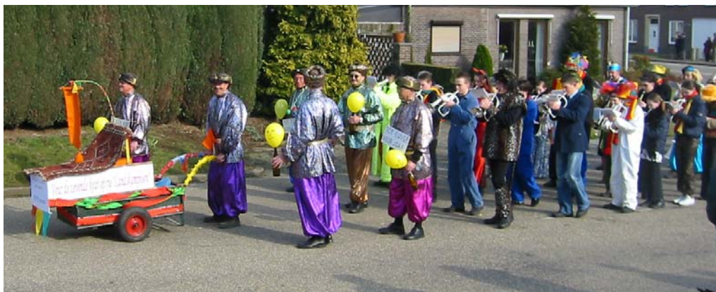
Ook de wimpel ging mee