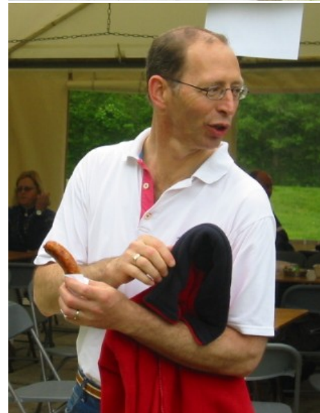
Erst de worst testen