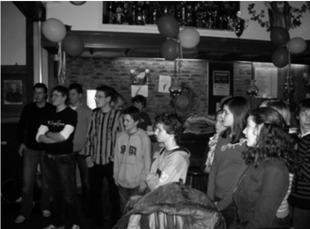
Foto: geslaagden bij de diplomautreiking